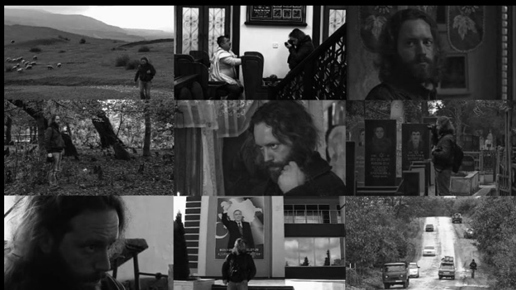
Alcuni fotogrammi tratti dal documentario video realizzato durante il viaggio in Azerbaijan che racconta da un altro punto di vista "One Way"

Nel 2016 ventiquattro foto in bianco e nero, scattate durante le registrazioni del loro album "La rivoluzione sta arrivando", diventano il calendario ufficiale dei " Negramaro ". Il rapporto tra Musica, Teatro e Fotografia, uno dei suoi principali "campi di ricerca", negli anni lo ha spesso portato a scattare sui set di molti videoclip musicali, sui palchi e nei backstage di festival e spettacoli musicali e teatrali.