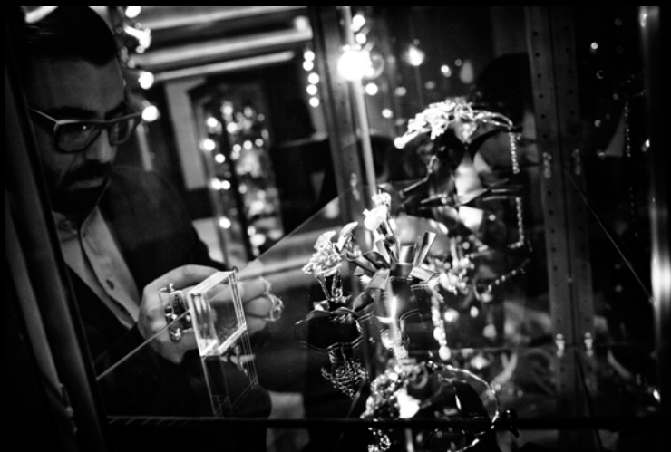
Una delle fotografie del reportage realizzato a Parigi durante "Vendôme Luxury Tradeshow"

2014 - Milano. Esposizione del reportage "One Way" (Sola Andata) realizzato in Azerbaijan negli spazi di NW-Architects, nell'ambito delle manifestazioni del FuoriSalone .