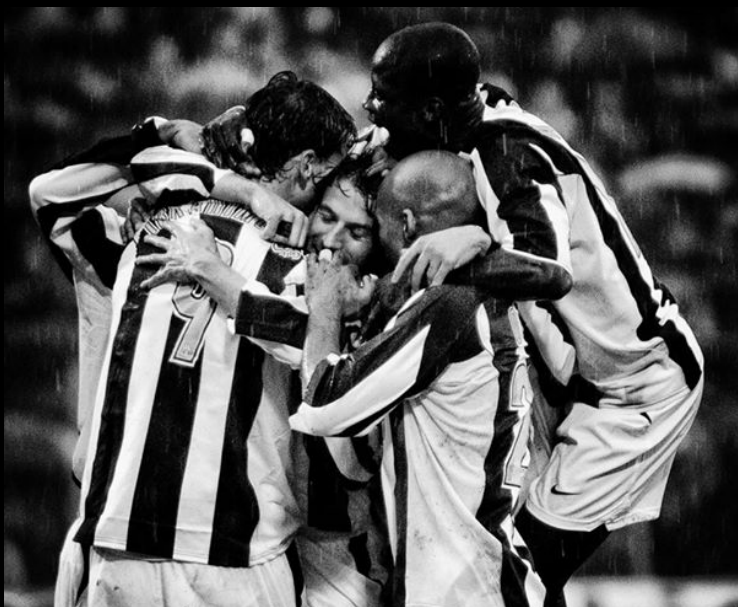
Una delle fotografie scattate durante il periodo di collaborazione con l'agenzia NewPress