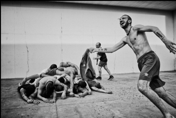
Una delle fotografie realizzate all'interno della Casa Circondariale di Lecce

2017 - Lecce. Fotografo dello spettacolo dei Cantieri Teatrali Koreja "La parola Padre".