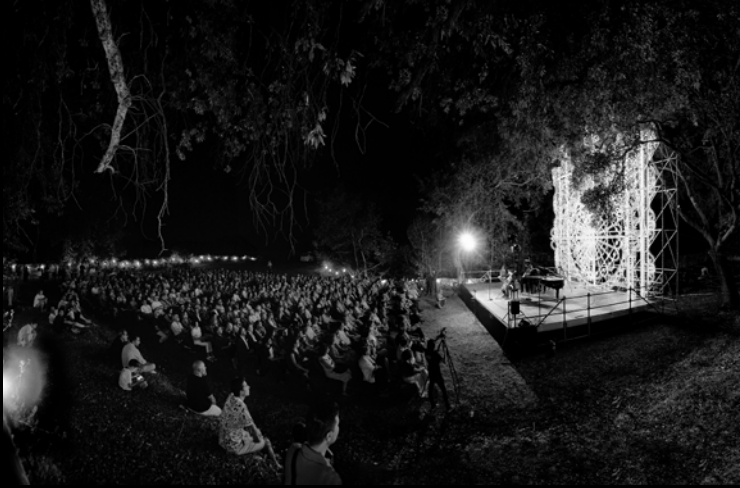
L'evento "La Romanza dell'Ulivo" presso la Fondazione Le Costantine.