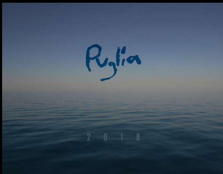
La copertina del Calendario 2018 della Regione Puglia