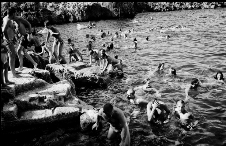
Una delle fotografie scattate sul set del videoclip "Sole" dei Negramaro