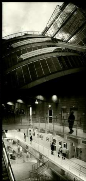
"The Darkroom Project" a Stoccarda

2015 - Mostra fotografica "Backstage", progetto fotografico a lungo termine, presentato per la prima volta durante il "Castro Film Festival" a Castro in provincia di Lecce.