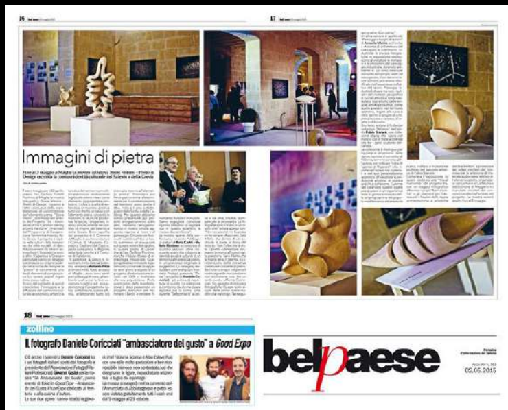
Due articoli dedicati al progetto "V.I.S." e all'Ambasciata del Gusto

2016 - Pubblicazione del calendario ufficiale dei "Negramaro". Un reportage realizzato nel Salento durante le registrazioni del disco "La Rivoluzione sta arrivando".