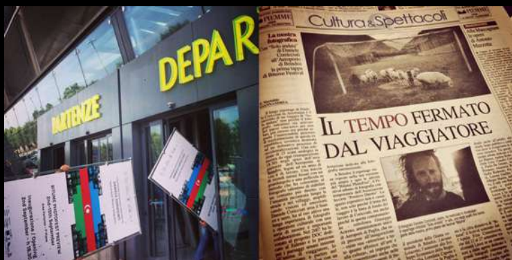
"One Way" all'Aeroporto di Brindisi