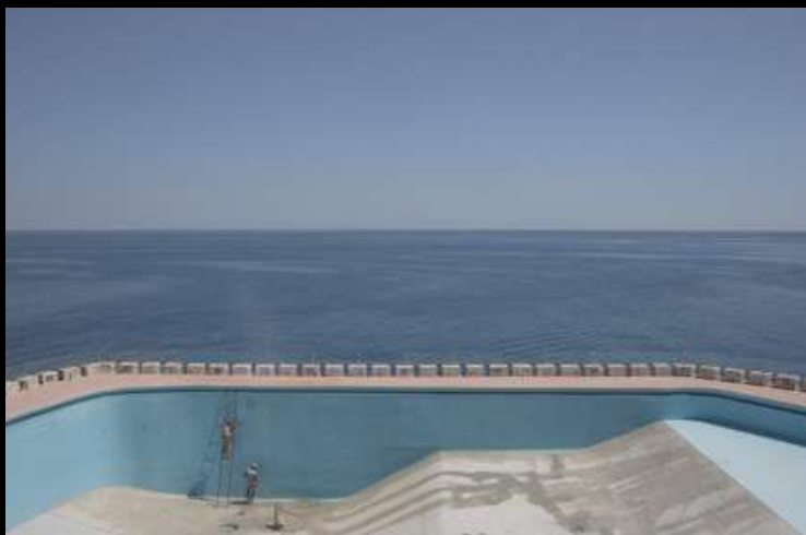
La foto finalista del concorso fotografico internazionale TAG PRIZE 2018

2019 - “Arrivano i Supereroi” , progetto nato da un’idea dell’associazione “Cuori e Mani aperte verso chi soffre ONLUS” , nel quale alcuni dei bambini del reparto di Oncologia pediatrica dell’ospedale Vito Fazzi di Lecce fotografati ispirandosi al progetto ONYOU .