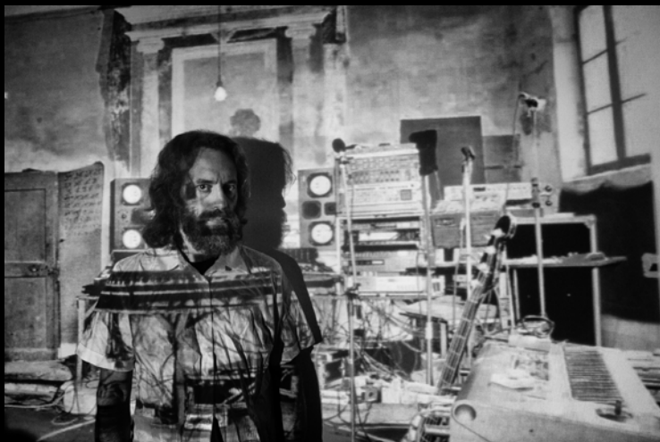
Autoritratto realizzato per il progetto "ONYOU"