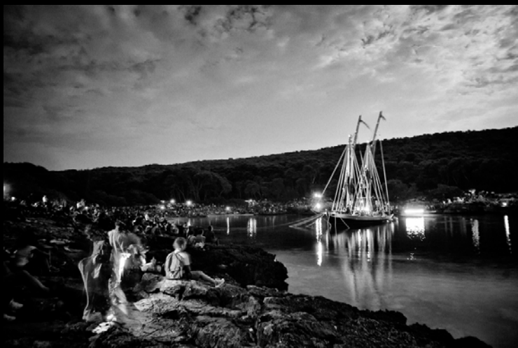
"SOLO", Porto Selvaggio