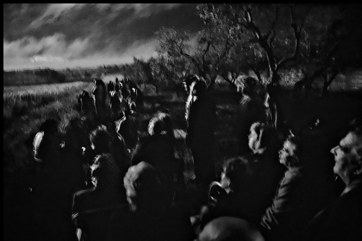
Una delle fotografie di "DOC", un ritratto fotografico del Salento, esposte al MIA Photo Fair 2017

2018 - Fotografo selezionato da "Obiettivo Fotografico" e da "deGusto Salento", Associazione del Negroamaro in collaborazione con il Policlinico Gemelli di Roma, per realizzare un reportage all'interno di dieci cantine vinicole della provincia di Lecce.