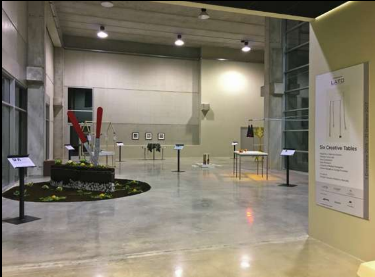
"Six Creative Tables", allestimento presso LATO Showroom